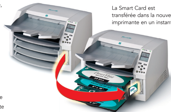
Illustration du modèle GS (3 cassettes d'approvisionnement)

La Smart Card est transférée dans la nouvelle imprimante en un instant!